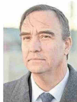
Gobernador Jorge Flies.