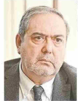
Diputado Carlos Bianchi.