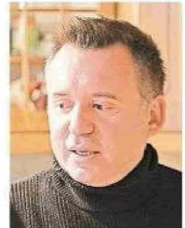
Alcalde Claudio Radonich.