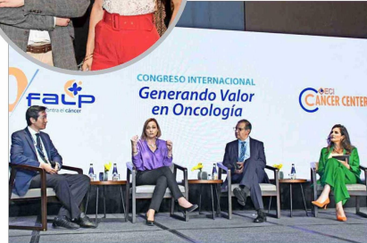
El Congreso Internacional FALP "Generando Valor en Oncología" congregó a más de 550 asistentes.