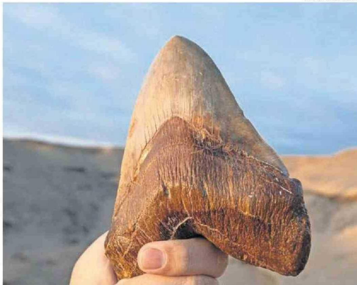
ESTUDIO DE UN FÓSIL ENCONTRADO EN LA REGIÓN, DE UN MEGALODÓN.