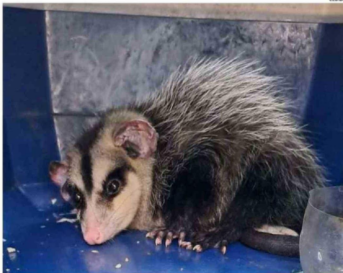
LAS MULTAS POR EL TRÁFICO DE ANIMALES EXÓTICOS PUEDEN SER HASTA LOS 200 UTM.

Sobre la procedencia, la autoridad, agregó que esta especie tiene una distribución geográfica natural en Bolivia, por lo que se presume que su presencia en las cerca-