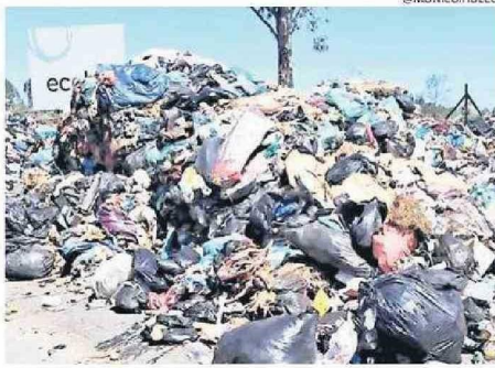
BOTANDO BASURA FUE PROTESTA POR DEMORAS EN DESCARGAS.

ble, de la Novena Región y del norte", detalló.