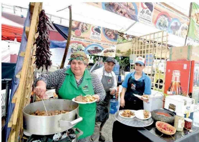
ROMERAL. Cientos de personas disfrutaron de la nueva versión de la Feria Gastronómica de la Plateada, que se llevó a cabo durante todo el fin de semana en la Plaza de la comuna.