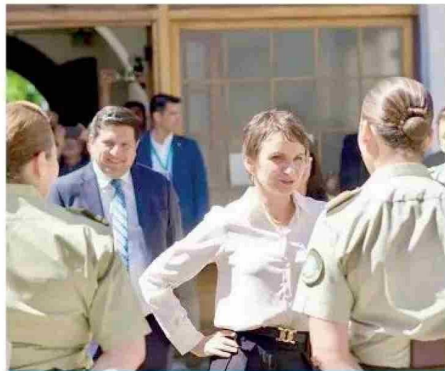
LINARES. Ministra del Interior y Seguridad Pública, Carolina Tohá, abordó materias de seguridad en su visita al Maule. “La Región del Maule presenta cifras muy positivas en el combate a la delincuencia”, comentó la secretaria de Estado.