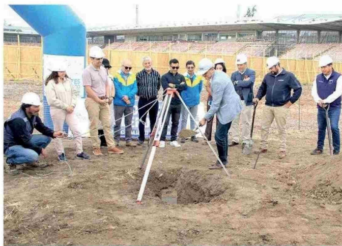
CURICÓ. Autoridades y dirigentes participaron en la ceremonia de colocación de la primera piedra de las obras para terminar -finalmente- el estadio La Granja. Se trata de la construcción de los codos, a lo que se suman una serie de mejoras en el recinto.