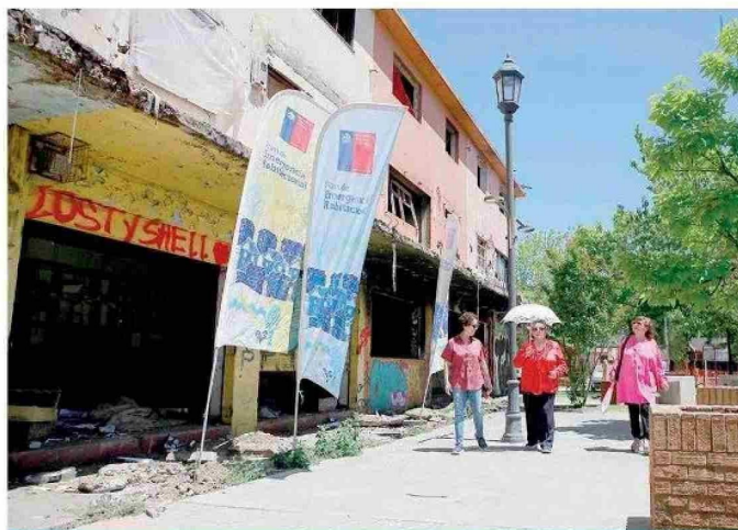
TALCA. Muy satisfecha se mostró la comunidad con el inicio de las obras de demolición en el Barrio Costanera. En el lugar se construirá el Proyecto Habitacional de Regeneración de Áreas Centrales - Talca, Barrio Costanera / Arriendo Protegido.