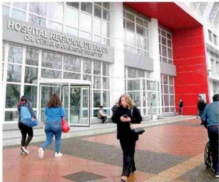
TALCA. Un urgente llamado hizo el Colegio Médico del Maule al Gobierno Central, en relación a la falta de recursos en los hospitales públicos de la región, los que no tienen presupuesto para llegar a fin de año.