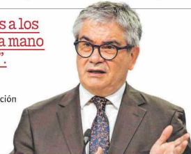
MARIO MARCEL Ministro de Hacienda habló sobre la remoción del jefe del SEA nortino que rechazó millonario proyecto de Colbún en Taital.

"A veces hay funcionarios a los que se les pasa un poco la mano en estos procedimientos".