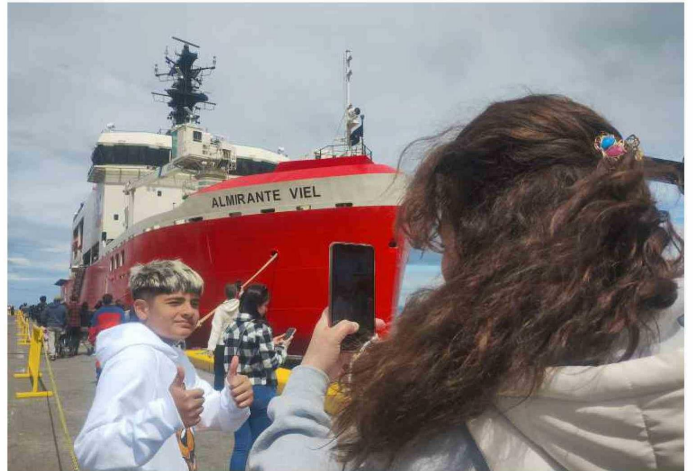
Pasadas las 11 de la mañana de ayer atracó el moderno buque que tendrá intensas visitas al continente blanco durante los próximos cuatro meses.