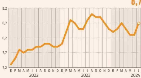
LA TRAYECTORIA DEL DESEMPLEO % TASA