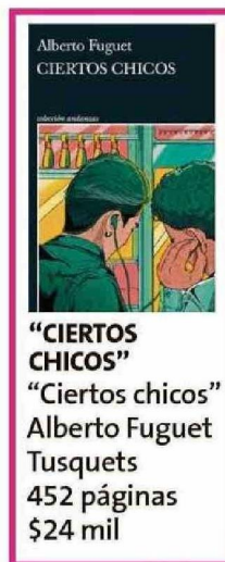
"CIERTOS CHICOS" "Ciertos chicos" Alberto Fuguet Tusquets 452 páginas $24 mil

quizás tiene otro tipo de poder. -Ahora esta novela pasa durante el régimen, época en que igual había fiestas, la gente se seguía enamorando. -Sí, pero yo lo veo de otra manera: obviamente que también había fiestas, y ahora, en Ucrania, igual, pero la cultura que celebran en este libro también es un acto de oposición, la vida contra la muerte, la cultura (de) el apagón se combate con luz. -No hay Eros sin Tánatos. -Exacto, va por ahí: en un mundo de Tánatos tienes que apostar por el Eros. Estos chicos no podían esperar a que llegara la democracia o tiempos mejores para vivir sus vidas. "ME DABA MIEDO" -¿Por qué escribir sobre la universidad después de tantos años de tu egreso? -Porque me daba miedo. -¿Porque te iban a molestar como a Clemente? -Sí, y porque lo mío fue una etapa muy traumática. -Porque te molestaban. -No sólo porque me molestaban, porque me parecía que era el infierno. O sea, el bullying es súper mo-