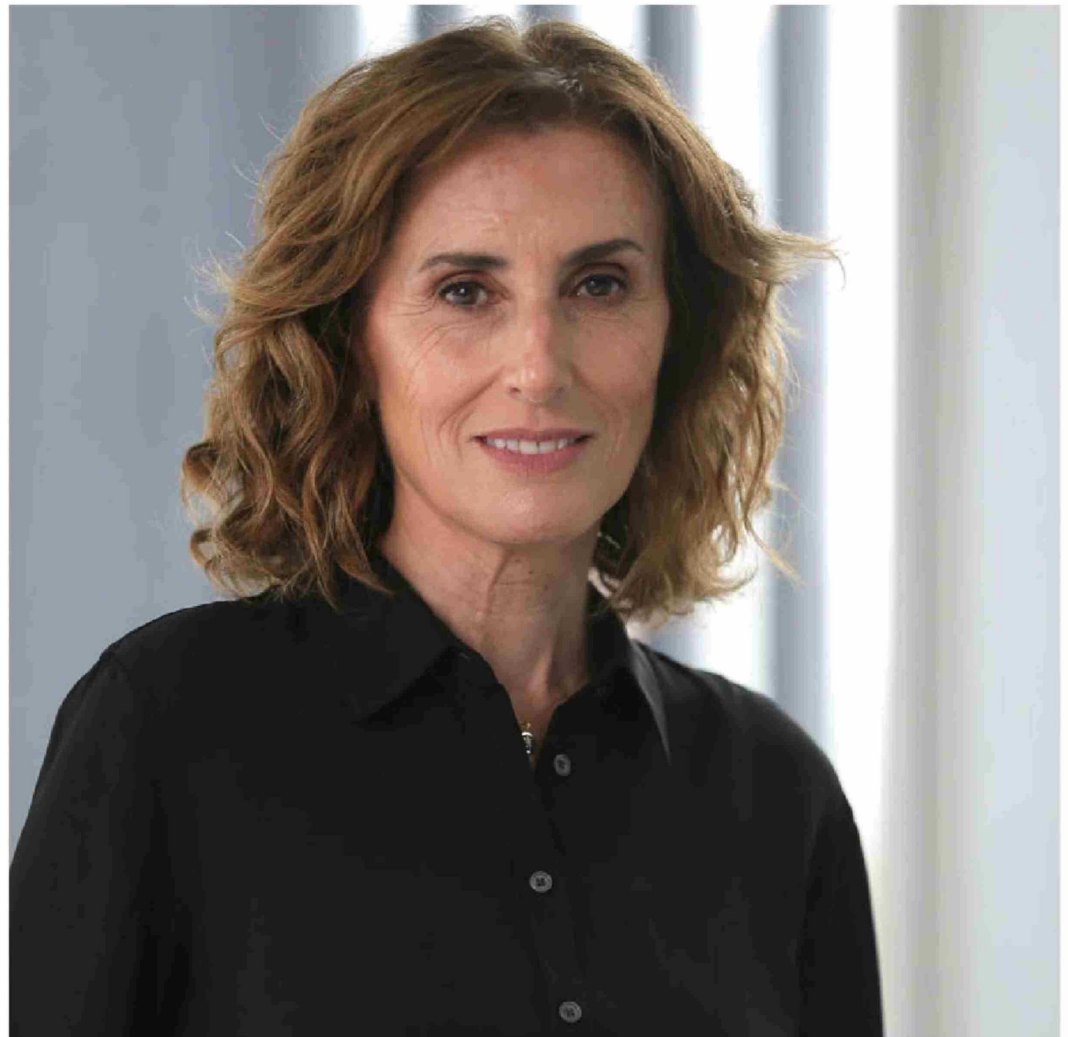
► La exministra de Educación del expresidente Piñera, Marcela Cubillos, actualmente es candidata a alcaldesa por Las Condes.

Conocedores del trabajo de la exsecretaria de Estado afirman que, precisamente por su rol en Libertad y Desarrollo, en un inicio tenía una menor vinculación con la casa de estudios y que durante ese período ejerció solo labores de docencia. Posteriormente se le