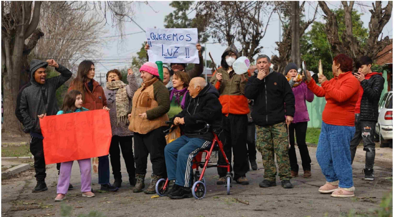
► La RM es una de las regiones más afectadas con los cortes de luz.