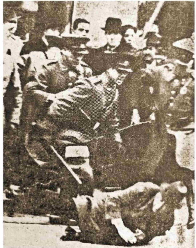
Carabineros reprime incidentes en el Congreso Nacional el 21 de mayo de 1938.

De esta pugna emergió la figura del coronel de Ejército, Carlos Ibáñez del Campo, quien se revelaría como el hombre fuerte, el que dirigía todo tras bambalinas. Cercano en primera instancia a Alessandri, fue uno de los oficiales que propició su retorno al país en el verano de 1925. El Presidente lo designó ministro de Guerra, mientras se ocupaba de sacar adelante la obra más importante de su gobierno, la Constitución de 1925 que puso fin al régimen parlamentario instaurado en Chile luego de la guerra civil de 1891. Sin embargo, a pocas semanas de que expirara su mandato, las tensiones crecieron entre ambos. Alessandri re-