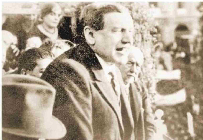
El Presidente Arturo Alessandri en un acto político durante su segundo gobierno 1932-1938.

Cuando el Presidente Pedro Aguirre Cerda visitó Magallanes en noviembre de 1939, a menudo se refería a la alta votación alcanzada en esta zona, lo cual le permitió llegar a La Moneda. En su despedida dijo: "Vine para agradecerle al pueblo de Magallanes y me voy más endeudado que antes"