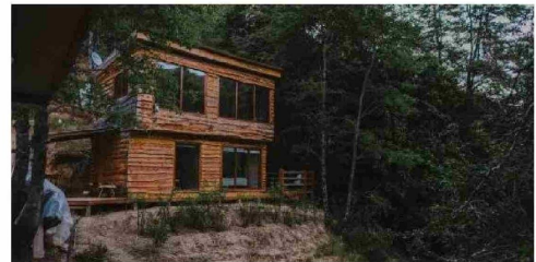
La oferta para desconectarse del ajetreo de la ciudad incluye alojamiento en cómodas cabañas.

El verano 2025 en la Cordillera de Nahuelbuta tendrá diversas actividades para disfrutar de este periodo estival, entre los que destacan el Festival Astronómico y el Festival Campesino, ambos a realizarse en enero, así como