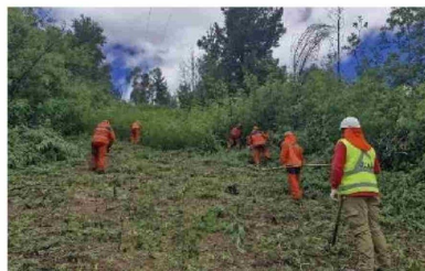
Junto a la comunidad y con todos los recursos en terreno la compañía avanza para asegurar el mantenimiento de su red eléctrica.