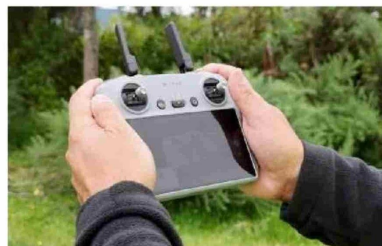
Junto a la comunidad y con todos los recursos en terreno la compañía avanza para asegurar el mantenimiento de su red eléctrica.

y sus clientes en agosto pasado. Este verano, Frontel continúa optimizando su respuesta mediante una red más resistente e inteligente para enfrentar los desafíos estacionales.