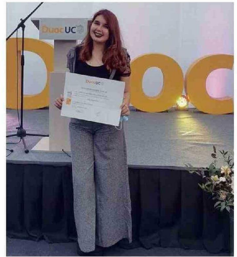
EN SU TITULACIÓN DE LA CARRERA DE GASTRONOMÍA.

na terminó sus estudios y realizó su práctica en diversos lugares de Santiago. "Pasé por pastelerías, trabajé en un hotel. Estuve, también, en una chocolatería, y luego estuve en un restaurante chino", explica. El 2022, se radicó definitivamente en Cartagena.