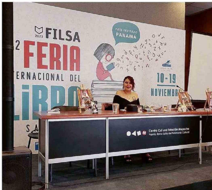
LA ESCRITORA AVECINDADA EN CARTAGENA EN UNA ACTIVIDAD EN LA FERIA DEL LIBRO DE SANTIAGO.

"Esto me ayudó mucho en cuanto a la personalidad, el saber caminar con