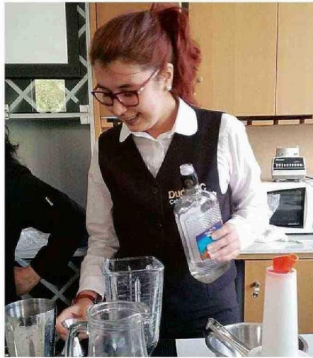
CUANDO ERA ESTUDIANTE EN UNA CLASE DE BAR Y COCTELERÍA.