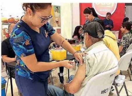
SALUD INSISTIÓ EN EL LLAMADO A VACUNACIÓN.

“Se trata dijo de personas que no se vacunaron y que declaran categóricamente que ahora sí se inocularán cada año y de manera tem-