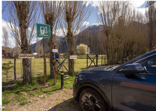
Las estaciones de carga en la Carretera Austral son ejemplo de un avance de infraestructura que es necesario seguir reforzando.