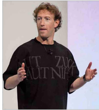
ZUCKERBERG pasó de crítico a fines de su otro gobierno a aliado.