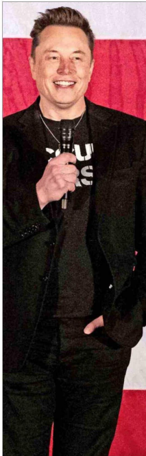
SIN DUDA Musk es el que más se ha acercado a Trump.

Desde Elon Musk hasta Mark Zuckerberg y otros líderes de grandes tecnológicas, varios en el mundo de las big tech ven en el nuevo gobierno una puerta a una mayor influencia que les permita avanzar en sus objetivos.