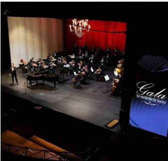
LA ORQUESTA FILARMÓNICA DEL TEATRO MUNICIPAL PRESENTÓ SU CONCIERTO "NOCHE DE BOLEROS", SIENDO EL BROCHE DE ORO DE LAS CELEBRACIONES DE LOS 144 AÑOS.