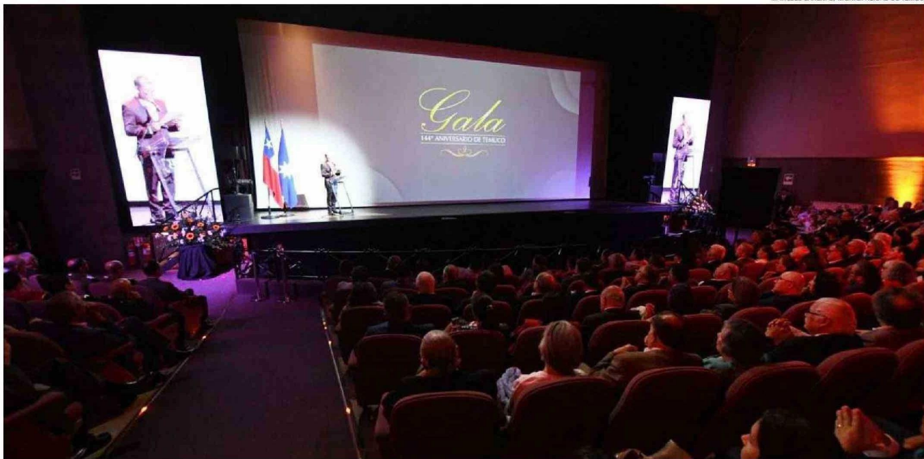
LA GALA ANIVERSARIO DE LOS 144 AÑOS DE TEMUCO SE DESARROLLÓ ANOCHЕ EN EL TEATRO MUNICIPAL CAMILO SALVO, CON LA PRESENCIA DE MÁS DE MIL 200 INVITADOS QUE REPLETARON LAS INSTALACIONES DEL RECINTO.