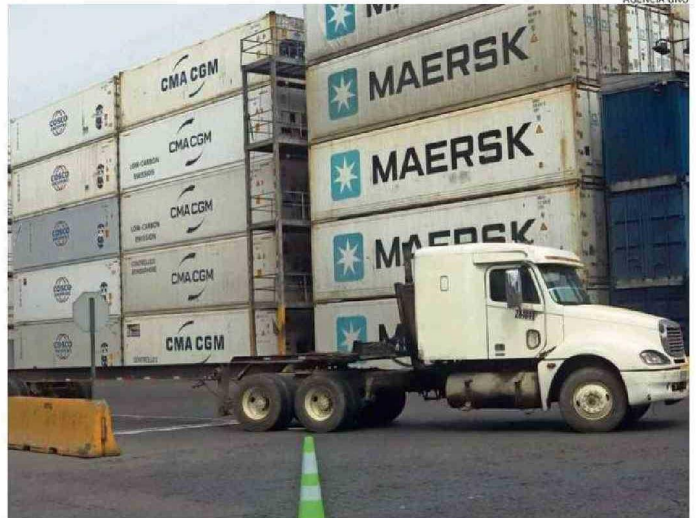
EXPORTADORES LOCALES DE CEREZAS PREOCUPADOS POR SOBRESTOCK EN MERCADO CHINO.

Asimismo, el director recaló que durante la temporada anterior se logró un récord de exportaciones. "Con respecto a la temporada de exportaciones, el 2024, batimos un récord histórico con más de 100.000 millones de exportaciones desde Chile al mundo. Como ProChile estamos orgullosos de ser parte