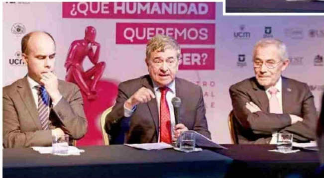
El senador Juan Antonio Coloma en su rol de presidente de la Comisión Desafíos del Futuro, Ciencia, Tecnología e Innovación de la Cámara Alta, afirmó que el encuentro planteará cómo se armoniza la tecnología de la información con nuestro desarrollo.