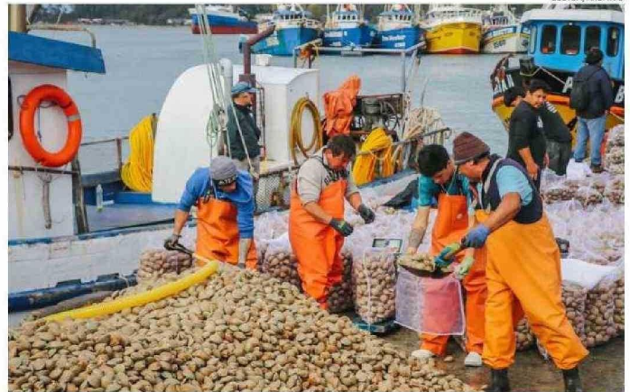
ESTE AÑO EL FOCO DEL PLAN ESTARÁ EN LA PESCA ARTESANAL CON UN AUMENTO DE RECURSOS.

“Ya el año 2024 el Gobierno Regional aprobó recursos para el bicentenario, esos recursos se aumentan en un