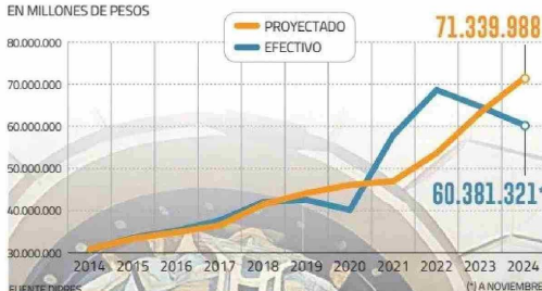
INGRESOS FISCALES PROYECTADOS EN CADA PRESUPUESTO Y EFECTIVOS EN MILLONES DE PESOS