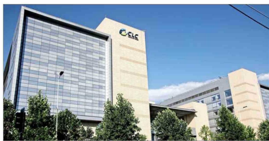
La operación busca fortalecer a la sociedad ante los retrasos de pagos de Fonasa e isapres, sostuvo la compañía.

La operación busca fortalecer a la sociedad ante los retrasos de