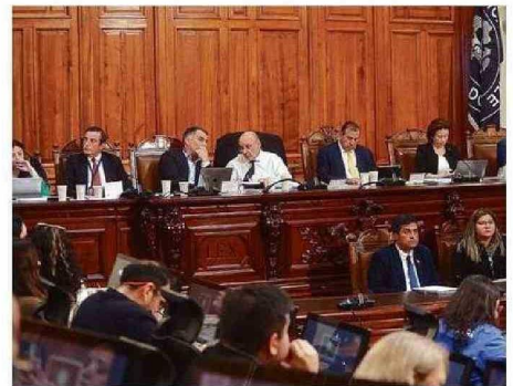
EL CONGRESO DISCUTE LA LEY DE PRESUPUESTO PARA 2025.

“En el pleno le solicité al gobernador acelerar el acuerdo que adoptamos como Consejo Regional de financiar la intervención quirúrgica de 500 perso-