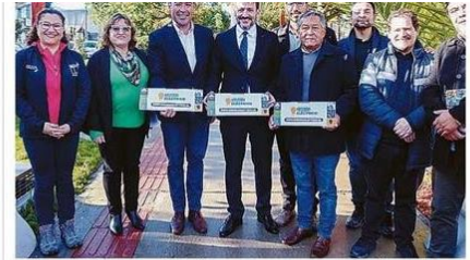
SECRETARIO DE ESTADO VISITÓ LA COMUNA DE PUCHUNCAVÍ.