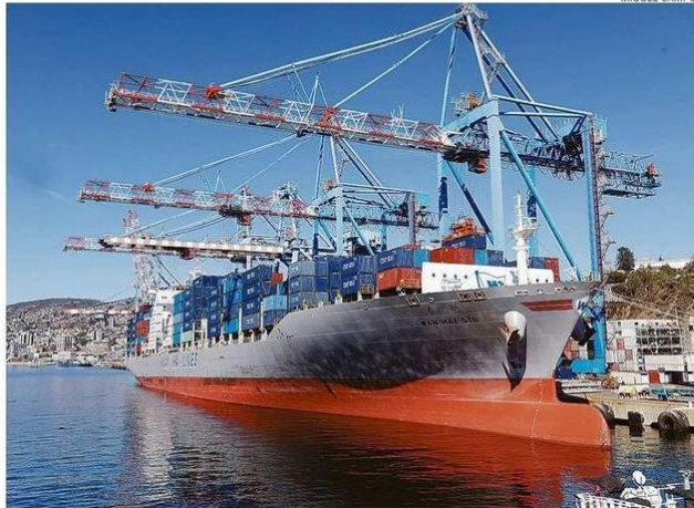
EL SITIO COSTANERA PODRÁ ATENDER A UN SOLO BUQUE DE GRANDES DIMENSIONES.

"Creo que al pasar de un puerto mayor como estaba pensado con dos terminales y con disposición para recibir cuatro naves en forma simultánea a uno de menor capacidad resuelve un problema con la ciudad y eso me parece bien. Acoge varias de las inquietudes