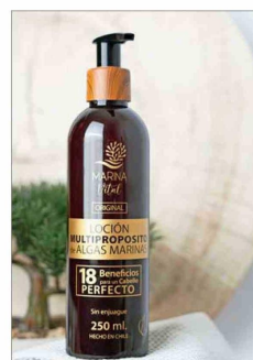
Loción multipropósito de algas marinas, el producto central de Marina Vital.