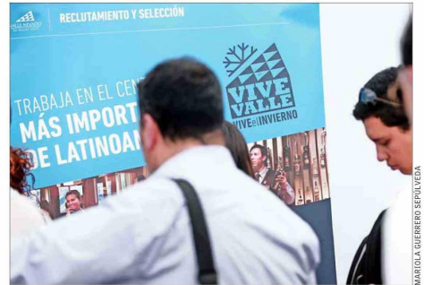
Los trabajadores entre 15 y 29 años son el segundo grupo etario con una mayor tasa de empleo precario.

aislada del panorama laboral general con una mayor informalidad (ver artículo inferior).