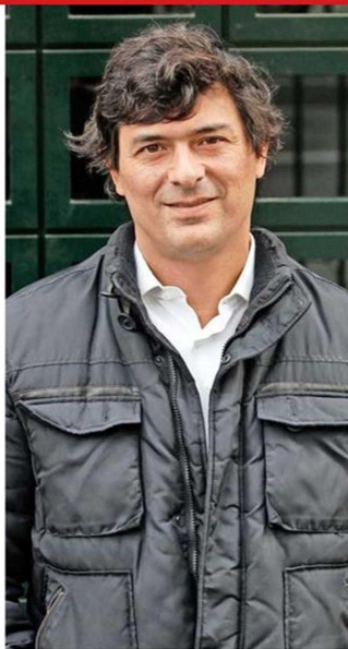
José Antonio Kast