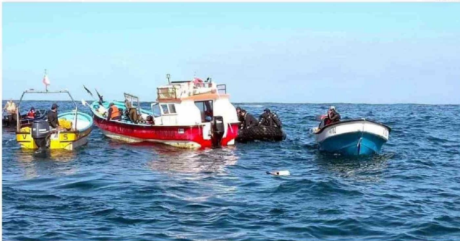
CERCA DE LAS 10 DE LA MAÑANA, SE HIZO EL HALLAZGO DE LA EMBARCACIÓN Y DE LOS TRES CUERPOS RESTANTES QUE FALTABAN POR UBICAR.

víctimas fatales que dejó este naufragio de la lancha "Río Cholguaco", la cual realizaba el recorrido de caleta Córdor a Bahía Mansa.