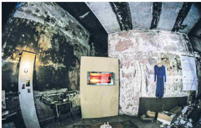
► Arriba, uno de los talleres que se realiza en las dependencias del Museo Violeta Parra. Abajo, parte de la exposición 20 años de la compañía Teatro Niño Proletario.

Guadalajara, organizado por la Universidad de Guadalajara. "La exposición se llama Recolectoras , y es de Violeta Parra y Mon Laferte", revela.