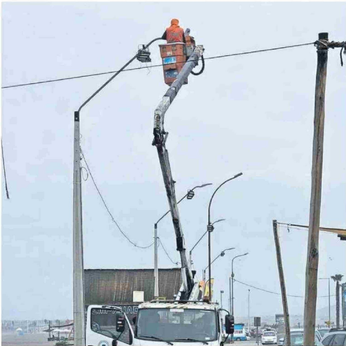
SE REALIZARON LAS REVISIONES CORRESPONDIENTES EN EL TENDIDO DEL SECTOR.

Autoridades llevaron hasta el sector para conocer en terreno las demandas de los locatarios in situ.