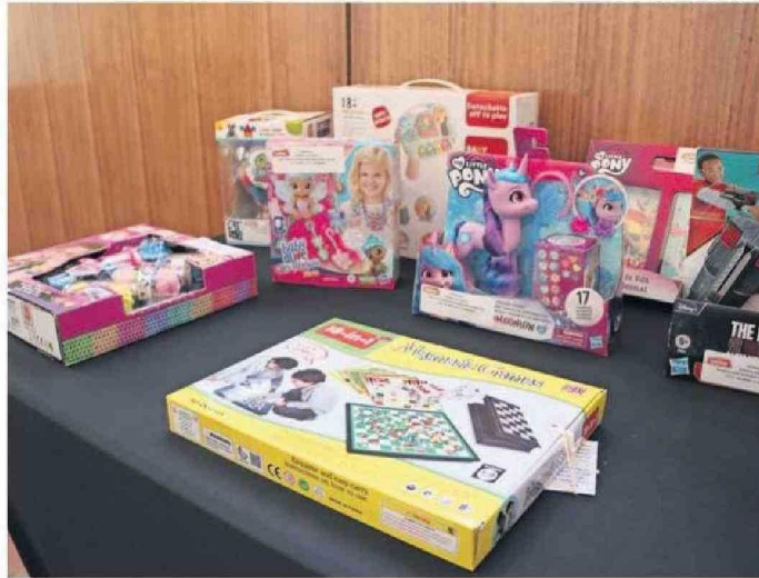
ESTE AÑO SE INCLUYERON REGALOS INCLUSIVOS PARA NIÑOS CON DISTINTAS CONDICIONES.