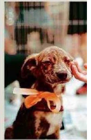
EL PRÓXIMO SÁBADO.