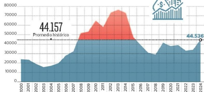
Catastro de la Corporación de Bienes de Capital (CBC), 2024-2027 En millones de dólares