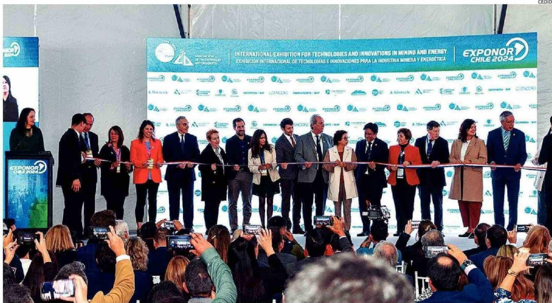
CASI 50 MIL PERSONAS SE HICIERON PRESENTES EN LA VERSIÓN DE ESTE AÑO. LA NUEVA VERSIÓN SERÁ REALIZADA EN 2026.