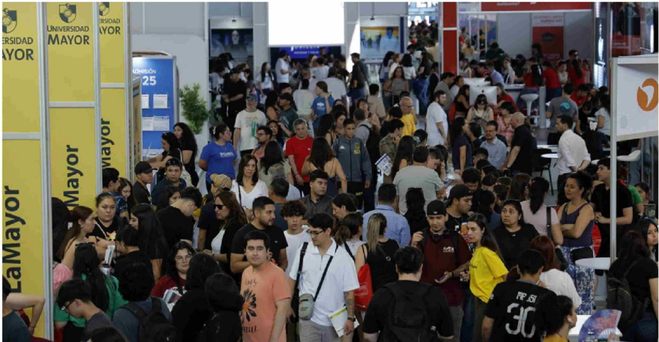
► La primera etapa del proceso de matrícula para la educación superior culmina este jueves.