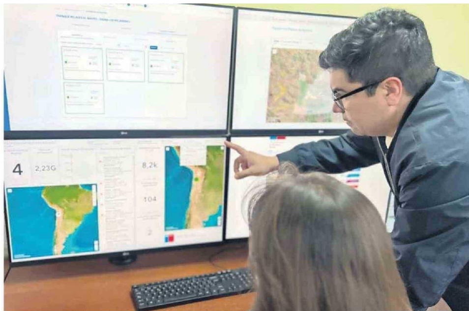
LA PLATAFORMA DE SERNAGEOMIN CENTRALIZA Y FACILITA EL ACCESO A LA INFORMACIÓN REFERENTE A LOS RELAVES A NIVEL NACIONAL.