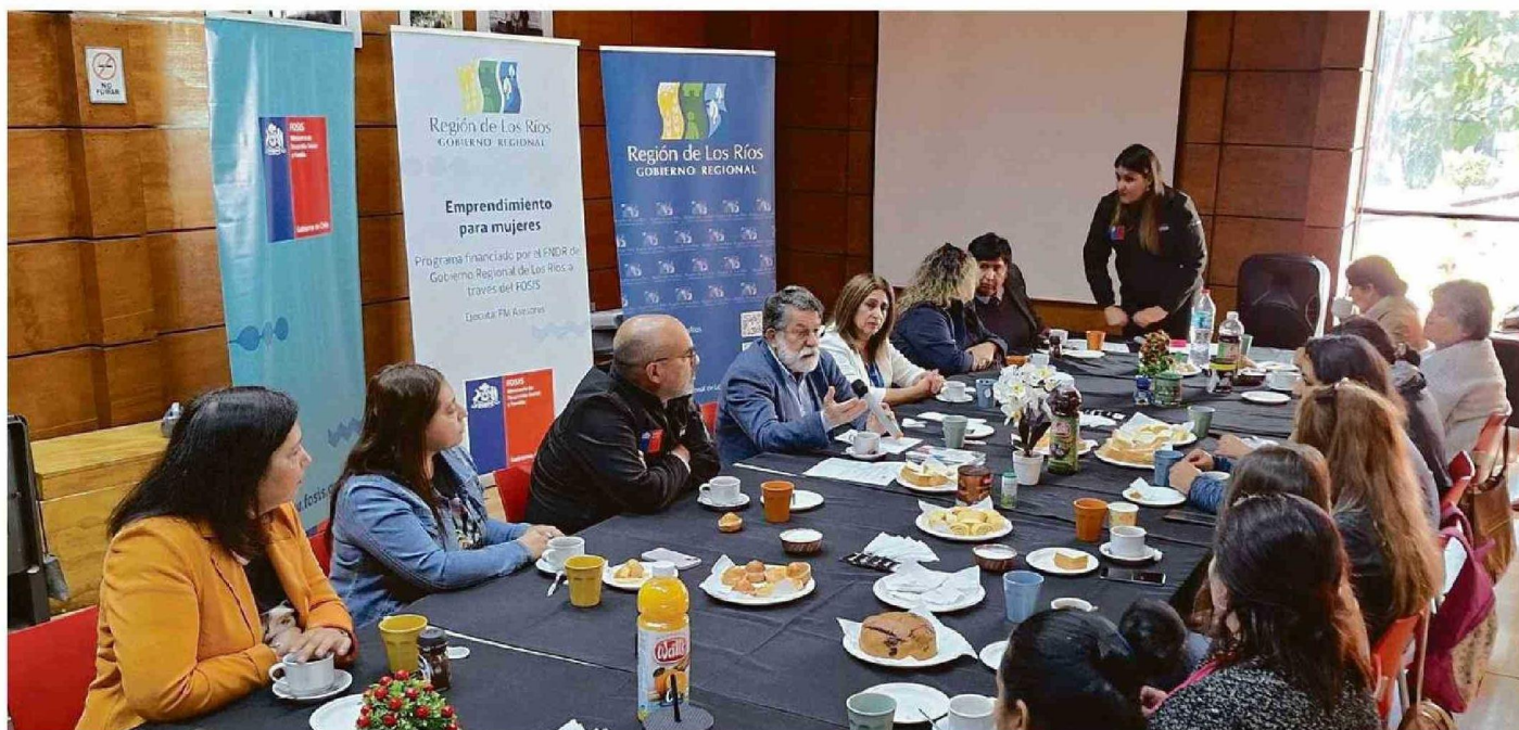
Autoridades regionales participaron de un desayuno con usuarias del programa en la comuna de Lanco.

El programa fue financiado por el Gobierno Regional de Los Ríos y su Consejo Regional a través de su Programa de Inversión por un monto de $350.000.000.