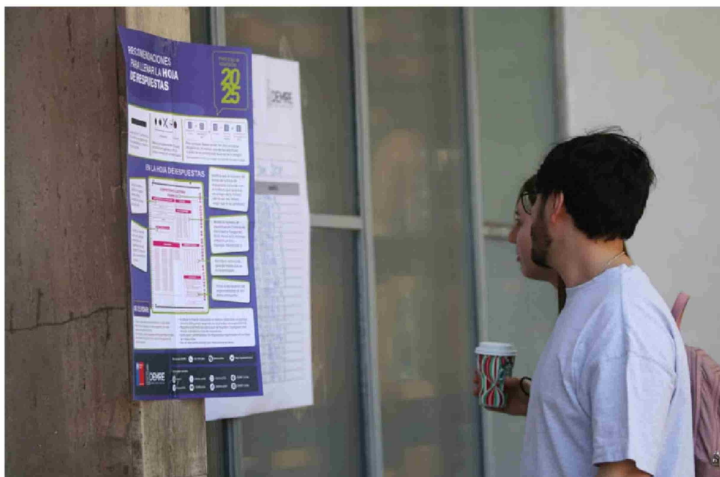
► Hay 22 establecimientos que el año pasado no estuvieron en el ranking de los 100 mejores y ahora, sí.

¿Y los liceos emblemáticos? Al que mejor le fue es el Instituto Nacional, ubicado en el puesto 303, con 702,4 puntos de promedio. El Internado Nacional Barros Arana (INBA), en tanto, afectado hace poco por la peor tragedia de su historia tras la explosión de un artefacto incendiario en sus dependencias, con sus 606,92 puntos de promedio quedó en el lugar 1.071 entre los más de 3 mil establecimientos con representación de alumnos. ●