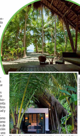
El resort presenta un compromiso con las prácticas sostenibles y el patrimonio cultural y natural del lugar.

Este destino ha sido reconocido tanto por viajeros como por medios especializados y líderes de la industria como uno de los mejores resorts del mundo. La combinación de su entorno natural prístino, su enfoque en la conservación y su atención a los detalles hacen de Isla Palenque una experiencia donde el lujo se encuentra con la responsabilidad ambiental en perfecta armonía.