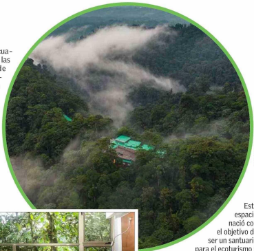
Este espacio nació con el objetivo de ser un santuario para el ecoturismo y la ciencia.

Además de su diseño minimalista y sostenible, las luces led de tono amarillo evitan atraer insectos, mientras que los productos de limpieza utilizados son completamente respetuosos con el medio ambiente. Todo está diseñado para minimizar el impacto humano y maximizar la conexión con la naturaleza. Pero este no es solo un lugar para descansar; es un espacio para aprender. Y es que el lodge es también un centro de investigación científica, donde un equipo liderado por un biólogo residente estudia la flora, la fauna y los ecosistemas acuáticos que lo rodean. Ecuador, país que alberga el 10% de las plantas del planeta y más de 1.700 especies de aves, encuentra en este hotel una trinchera donde se protege y celebra esta biodiversidad. Para Roque Sevilla, el objetivo es claro: que cada visitante experimente el bosque no como un espectador, sino como parte de un todo, comprendiendo que no somos los dueños de la creación, sino sus humildes participantes.