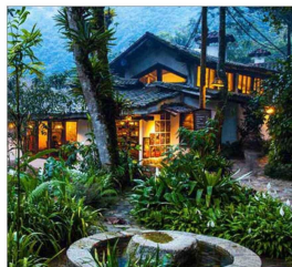
83 villas de adobe componen este proyecto, que reforestó cinco hectáreas.