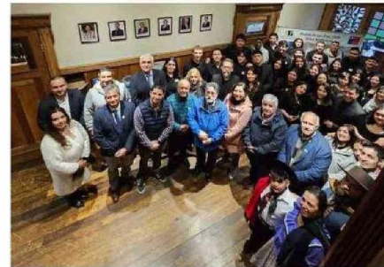
ASOCIACIÓN CULTURAL BINACIONAL CORDILLERA DE LOS ANDES

PRESENTACIONES ARTÍSTICAS, TALLERES, REUNIONES CON AUTORIDADES, FUERON PARTE DEL PROGRAMA DE ACTIVIDADES EFECTUADO EN LA REGIÓN.