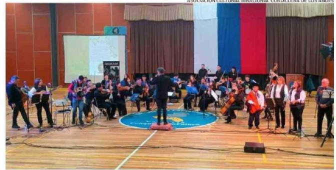
ASOCIACIÓN CULTURAL BINACIONAL CORDILLERA DE LOS ANDES