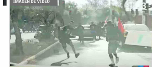
Un ataque recibió ayer un vehículo de un equipo de Canal 13. Por el momento hay un detenido.

ra el resto de familias que iban acompañando a sus deudos”, resaltando que “dado que no existe una aprobación del proyecto de ley de denominados funerales de alto riesgo, no teníamos fa-