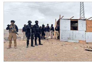
Para muchos expertos, este año fue la consolidación del crimen organizado, incluyendo trata de personas explotadas en delitos sexuales. En la imagen, personal de la PDI en un operativo contra el Tren de Aragua.

Las cifras oficiales demuestran que cada año aumentan las denuncias por delitos sexuales (ver infografía). De acuerdo al Ministerio Público, este incremento ha tenido un repunte en especial tras el estallido social y la pandemia. Sovino apunta, por ejemplo, a que años atrás el Ministerio Público estaba acostumbrado a recibir al año “entre 20.000 y 30.000