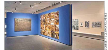
"Por la línea corre el tren" se podrá visitar hasta las 21:00 horas y con entrada gratuita en el CCLM.