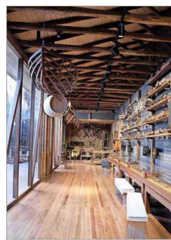
Museo Taller , en el barrio Yungay, brindará la posibilidad de aprender haciendo.