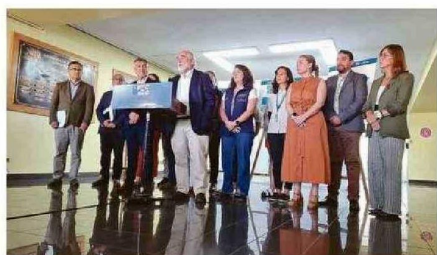
EL 2,5% DE FAMILIAS HAN RECIBIDO UNA SOLUCIÓN HABITACIONAL.

En total, 6.217 casas en la Región de Valparaíso han sido catastradas por el Minvu tras la emergencia. Gobierno busca dar soluciones a unas 3.043 familias. A 626 se les asignó un subsidio habitacional y solo 78 casas fueron entregadas.