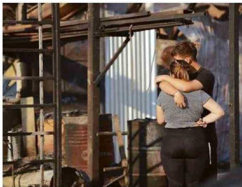
PROCESO DE RECONSTRUCCIÓN LLEVA SOLO UN 26% A LA FECHA.