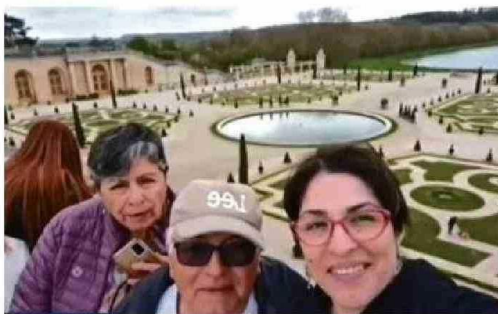
"TOÑO" VIAJÓ A EUROPA JUNTO A SU ESPOSA Y SU HIJA.

Pese a que su estado es de cuidado, la semana pasada comenzó a respirar sin apoyo de oxígeno. En los próximos días podría volver desde Viena.