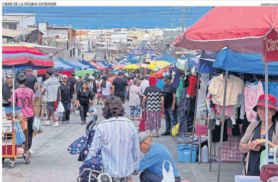
LA TRADICIONAL CALLE PANTALEÓN CORTÉS QUE DA ORIGEN AL NOMBRE DEL POPULAR SECTOR.