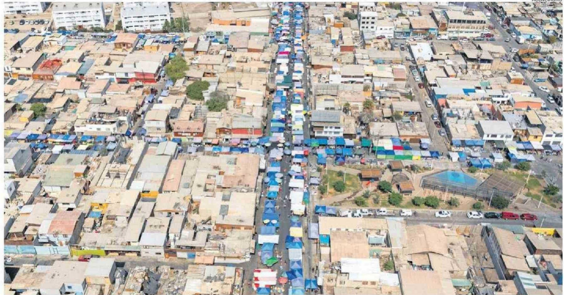
EL FIN DE SEMANA EL COMERCIO AMBULANTE SE EXPANDE POR LOS PASAJES DE LA VILLA BULNES Y BALMACEDA GENERANDO UNA SERIE DE INCIVILIDADES PARA LOS VECINOS DEL SECTOR.

La locataria tiene un frecuentado puesto de empanadas en la esquina de calle Pantaleón Cortés con Nicolás González.