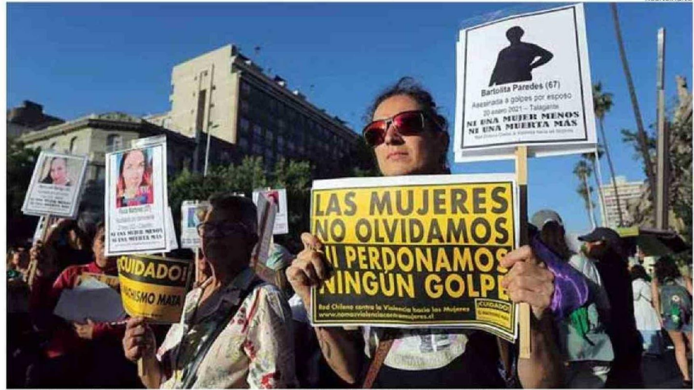
EL SERNAMEG CONTABILIZA 6 FEMICIDIOS FRUSTRADOS EN LO QUE VA DE AÑO, LA MISMA CANTIDAD DE TODO EL 2023.