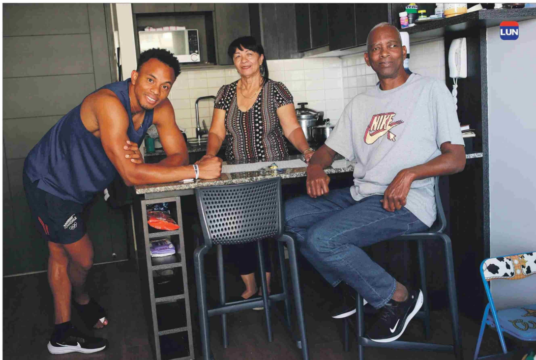
Ford está feliz y ahora vive en el mismo condominio junto a toda su familia.

El campeón del decatlón Santiago 2023 se recupera de una cirugía junto a sus progenitores que dejaron Cuba para residir en Chile.